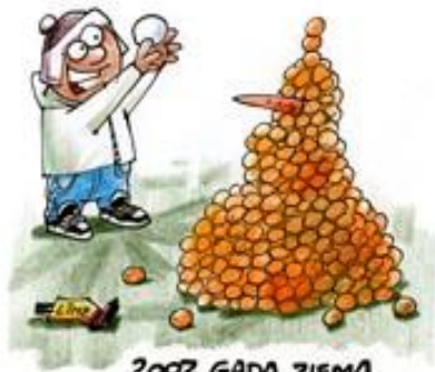
2007. GADA ZIEMA

Otrs sajūtas neveikli un nolemj samelot: - Jā, redzēju gan! - Bet kāpēc tad iekāpi?