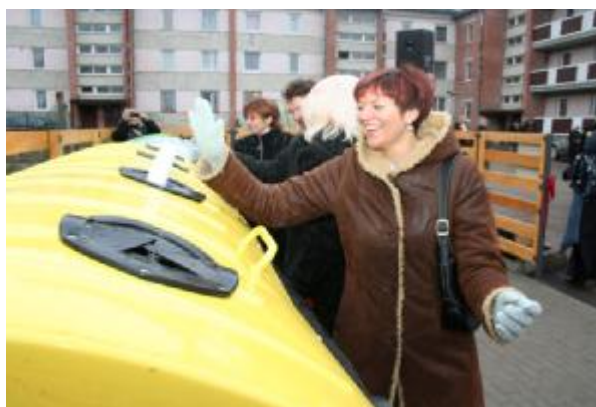
Atkritumu šķirošanas punktu atklāšana 2007. gada decembrī.

Kartons ir viens no izplatītākajiem materiāliem dažādu preču iesaiņošanai. No otrreizējā kartona var ražot: jaunu kartonu, sienu apdares plāksnes, grāmatu vākus u.tml. Tāpat kā avīzpapīru, arī kartonu jāvāc atsevišķi, un tas nedrīkst būt piesārņots. Parasti īpaša vērība tiek pievērsta tam, lai izvairītos no piesārņotajiem, kuru klātie padara kartonu nederīgu pārstrādei: tie ir metāla un koka piejaukumi, pārtikas produktu paliekas, aizsarg pārklājumi (polimēri, vaski).