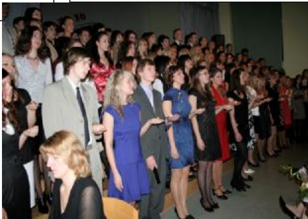
Aizkustinošais pasākums- Žetonu vakars.