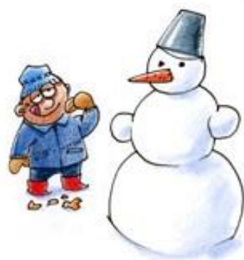
1987. GADA ZIEMA

Redzēji? - Nē. - Tu ko? Nupat irbe aizlidoja! Iet abi tālāk. Pēkšņi pirmais atkal prasa: - Redzēji? - Nē? - Pavisam akls esi? Zaķis aizskrēja! Iet abi atkal tālāk. Pirmais pēkšņi atkal prasa: - Redzēji?